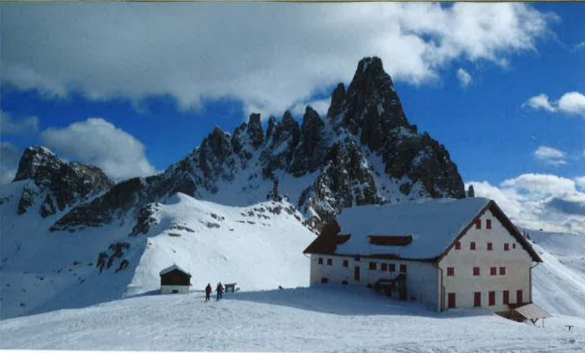
Pri koči, ki je izhodišče za krožno pot Tre Cime di Lavaredo in velja za nekakšno »vstopno« turo v Dolomite, nas pozdravi sonce.

za dolgo, saj se pretežno položna pot z razgledi za čisto desetko kmalu spet zavije v meglo. Prečimo do kapelice in nato do kočice Lavaredo. Malce počitka in že sledi vzpon do sedla, kjer zaščitni znak Dolomitov pokaže svoj pravi obraz.