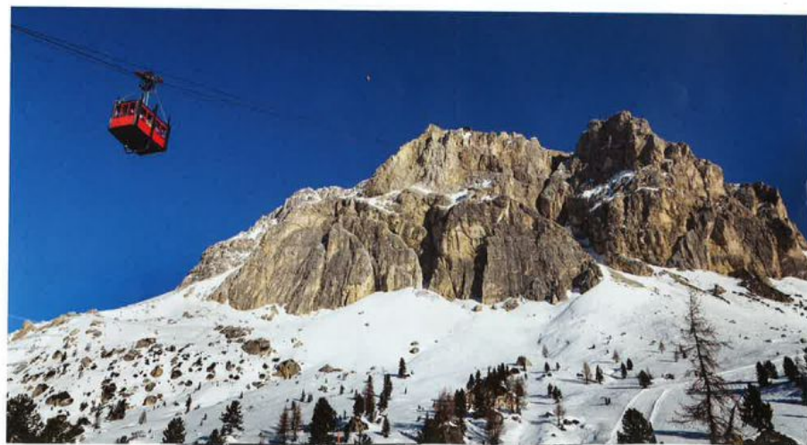
Gondola s prelaza Falzarego na goro Lagazuoi

Mesece kasneje, pod črto leta 2022: Ali veste, katere je bila ena najboljših odločitev preteklega leta? Da bom nekaj storila prvič. ■